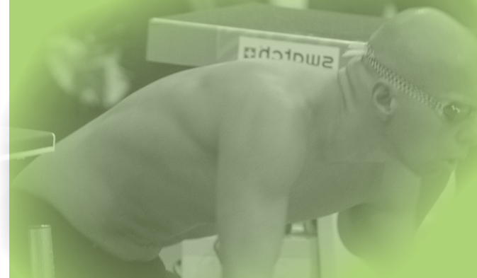
Xavier Torres Ramis

Deportista española más laureada – 22 medallas paralímpicas, 5 récords del mundo, 11 medallas en mundiales, 29 en europeos.