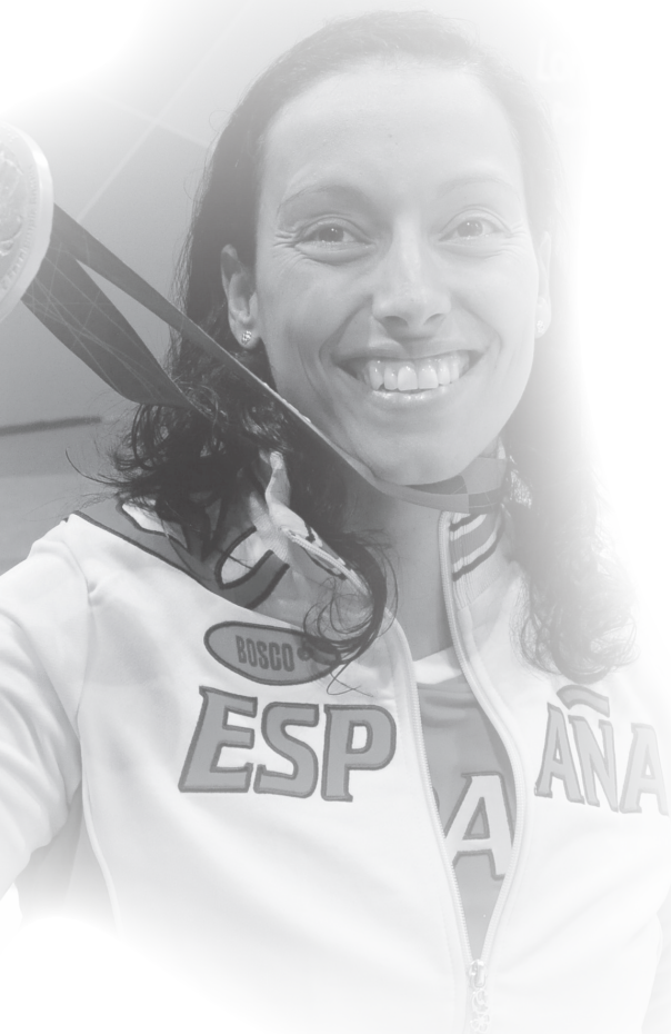
Ponente invitada Teresa Perales

Esta formación, dirigida a los profesionales implicados en la educación, desarrollo y entrenamiento de personas con discapacidad, pretende convertirse en un programa de referencia que cubra la carencia actual de formación específica, dotando a los alumnos de los conocimientos y las herramientas necesarias para poder desarrollar y poner en marcha los diferentes programas de intervención y entrenamiento.