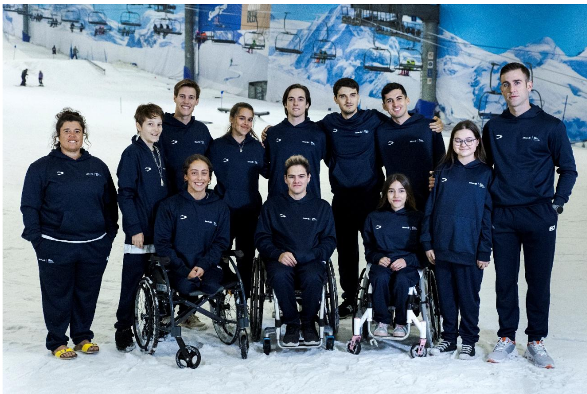
Concentración del Equipo Allianz de Promesas en 2022